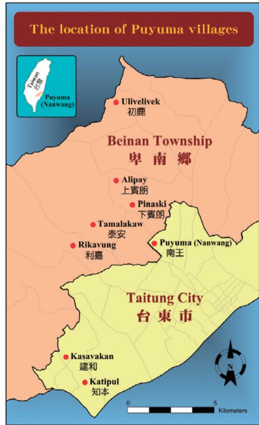
圖 2-4-1-4 卑南族村落分佈圖（中研院語言所林志憲先生協助繪製）