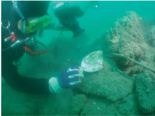
圖 2-4-1-1 澎湖馬公港疑似古沉船調查水下作業情形